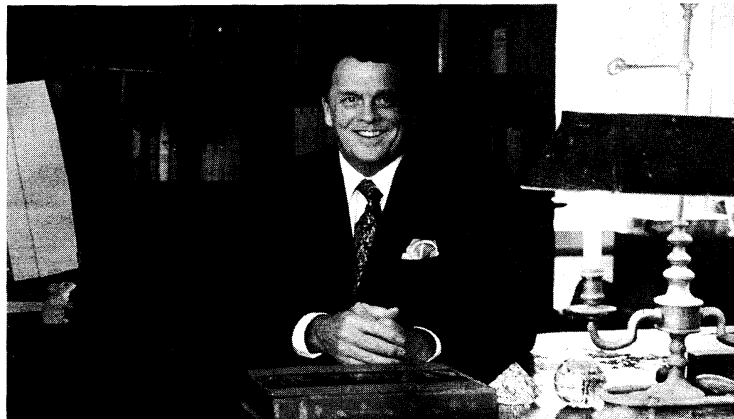
El escritor Spencer Johnson, en su despacho.

-¿Este éxito ha cambiado su vida? -Sí y no. Sí, en el sentido de que me ha dado más energía, ya que es muy bueno ayudar a gente que no conozco. Y no, por algo que tengo claro. He visto demasiadas vidas de personas con éxito deterioradas. Por eso, es importante determinar qué tiene que cambiar y qué no. Si no conservas los pies en el suelo, puedes perder tus valores. Es uno de los motivos por los que no pongo mi foto en los libros y no me he vuelto famoso. La fama